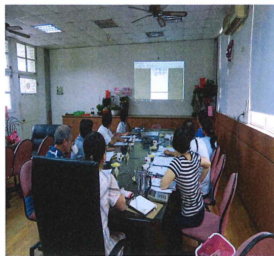
說明：預算書圖審查-聽取工程顧問公司預算書圖簡報說明